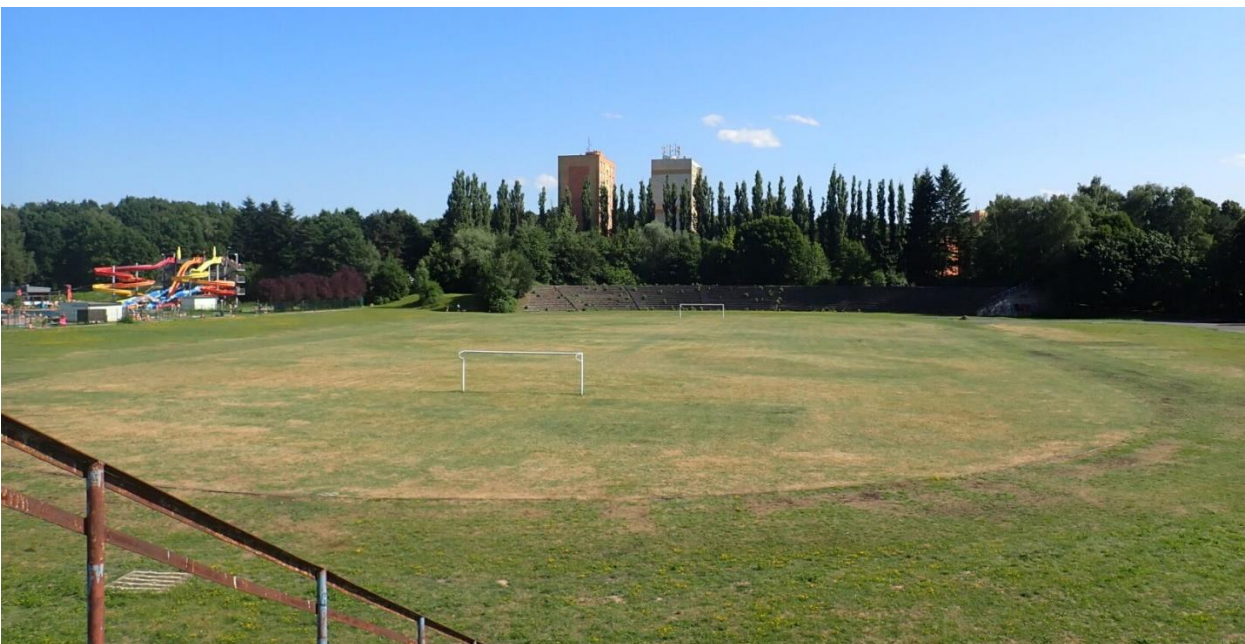
Pohled na území stadionu Svazácká v Ostravě-Jihu, které sousedí s areálem koupaliště.

Do přípravy rozvoje území byli zapojeni také občané. Výstupy z této participace budou sloužit jako podklad pro zpracovatele projektu.