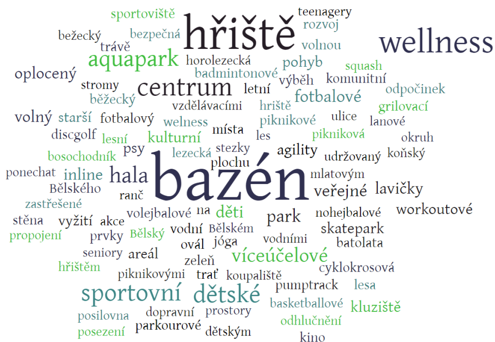
Mrak slov zobrazuje klíčová témata a jejich četnost v kontextu poptávky volnočasových aktivit.