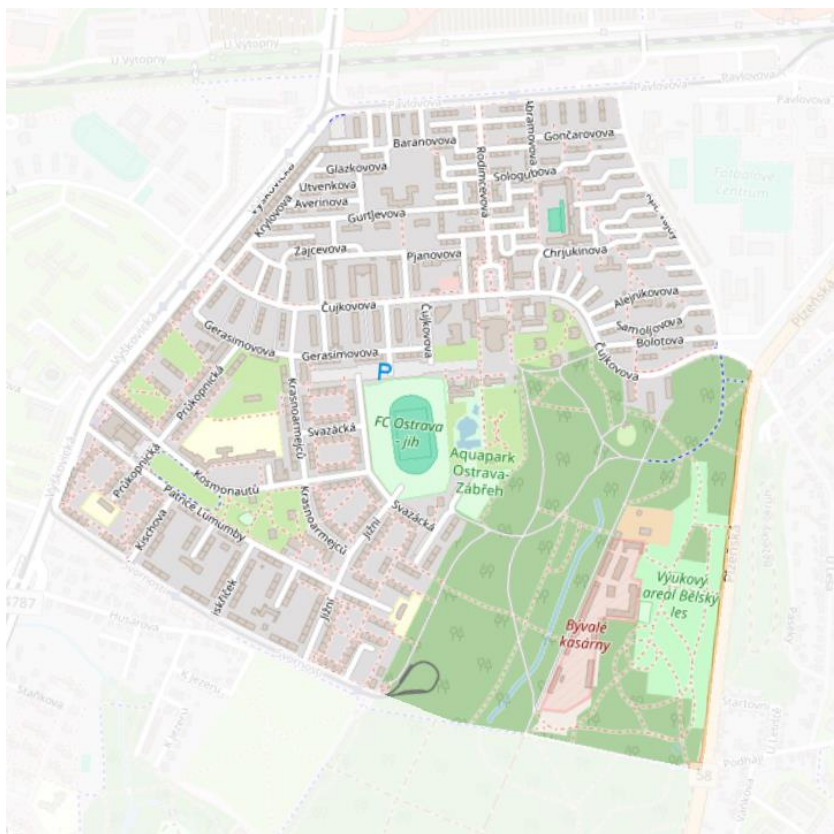
Zájmové území použité pro zjišťování podnětů participace.

Kromě kvantifikovatelných otázek byla na odpovědi uplatněna tematická analýza a byla tak stanovena témata, ke kterým se občané nejčastěji odkazují. Jsou přiloženy také příklady výstižných nebo naopak netradičních odpovědí. Ty mají poskytovat ilustrační obrázek o názorech občanů, nevyjadřují názor většiny.